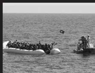
Les migrants ne savent pas nager (France, 2016) Samedi à 15h à l’Auditorium

Ce film bouleverse par son authenticité, mais donne également foi en l’humanité grâce aux nombreux témoignages de bénévoles engagés et révoltés par l’absence de réactions. Leur engagement donne envie de continuer à se battre face aux atrocités dont nous sommes tous spectateurs, mais trop souvent passifs. ■